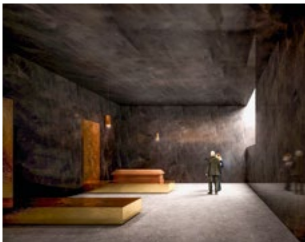
Wie beim Siegerprojekt berühren sich in der Säulenhalle Gebäude und Park. Das Innere von Projekt «7376» auf dem 4. Rang ist mutig und konsequent entworfen: Nur wenige Lichtöffnungen kontrastieren mit den dunklen Räumen.