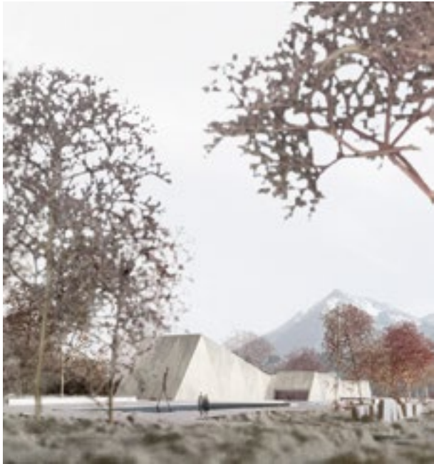
Das Krematorium als zerklüftete Landschaft: Die Form faszinierte die Jury – die Nutzung warf viele Fragen auf. Das Projekt «Six Feet Under» wurde mit dem 6. Rang bedacht.