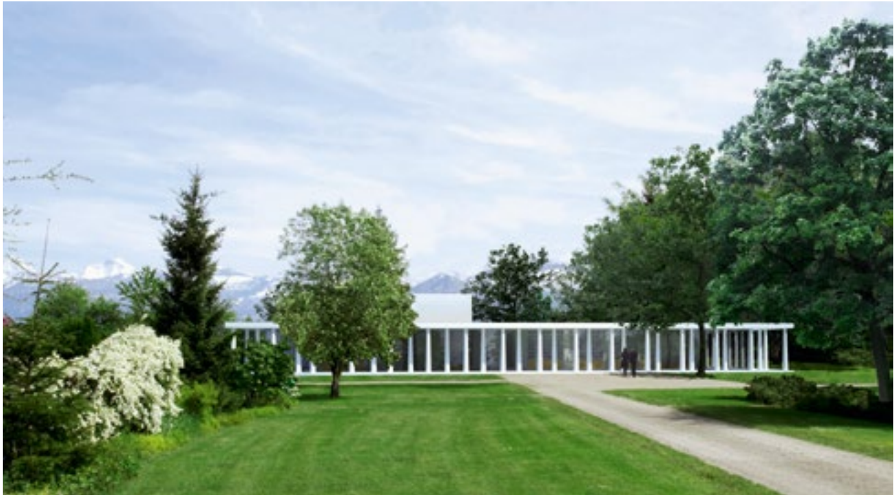
Die zweireihige Kolonnade mit versetzten Stützen verleiht dem Siegerprojekt «Obon» seinen würdevollen Auftritt. Gleichzeitig verbindet sie das Gebäude mit dem Park. Architektur und Landschaftsarchitektur treffen sich auf Augenhöhe.

E s scheint eine prestigeträchtige Aufgabe zu sein: Rund 200 Büros haben die Unterlagen bezogen. Am Ende lagen dann 136 Projekte vor, die die Jury zu beurteilen hatte. Die Faszination für diesen Wettbewerb lag gewiss in der Möglichkeit, die skulpturalen und monumentalen Seiten der Architektur auszuloten – im Krematorium bietet die Form Halt in der Trauer, und sie drückt das Unausprechliche aus. Oder um es mit dem berühmten Zitat von Adolf Loos zu sagen: «Die Architektur gehört nicht unter die Künste. Nur ein ganz kleiner Teil der Architektur gehört der Kunst an: das Grabmal und das Denkmal.» Die Nähe zum Grabmal